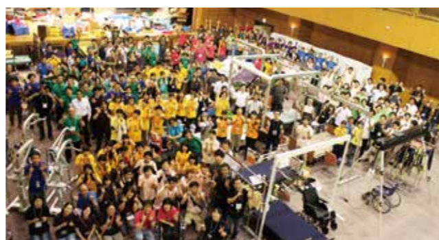
スタッフ約300人！「自分らしく」を応援します！

来場して下さった皆さんにとって本当に必要な物を見つけることができるように、メーカー別ではなく、機器・用具の種類毎に分けて展示しています！ 一人ひとりに合った、可能性を拓ける機器や用具と一緒に探していきましょう。